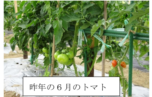
昨年の6月のトマト

☆4月に植えた、トマト、ナス、キュウリ、ピーマンの苗がどんどん生長し実をつけます。成長が早いので、こまめに農園に来て、管理し、収穫を楽しんでください。 ☆成長と共に追肥も必要です。下の予定に沿って行ってください。